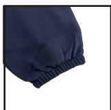
しっかりとしたリブ 腰ドロークコード

裾はゴム仕様で動きやすく、スッキリとした印象に スポーティー、リラックスな上、着心地にこだわりました ゴム上のボリューム感とのメリハリも雰囲気良し