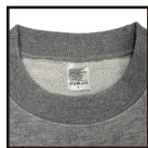
ブランドレスネーム

ブランドのロゴや名称の記載のないネームを採用 blankボディとしてオリジナル商品作成に最適 切り取り不要でオリジナルネームをつけるだけの手間いらず