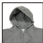
細部へのこだわり

着こなしのアクセントになるのはもちろん、 ちょっとした小物を入れたり、手を温めたり 何かと重宝するポケット