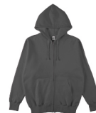
ダークチャコール