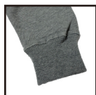
しっかりとしたリブ

スウェット生地でスタンダードな10ozの裏毛生地 柔らかく、裏のパイル地は肌触りもバツグン 綿100%なので毛玉に悩まされることもありません