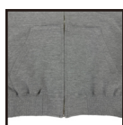
カンガルーポケット

老若男女問わず着用できるよう設計されたボディ、 サイズやカラーも豊富でどんな用途にもフィットします スタンダードなスタイルゆえ広く長く愛される1枚です