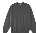
ダークチャコール