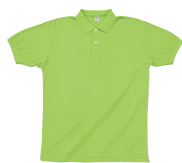
アップルグリーン