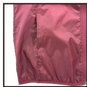
実用的なポケット位置

ファスナーを上まで上げたときに、あごや口、顔に当たらないよう守るパーツ 引っ掛かりや不快感を軽減でき、着心地の良さに繋がります 雨、風の侵入を防ぐ効果もあり、小さいながら役に立つひと工夫